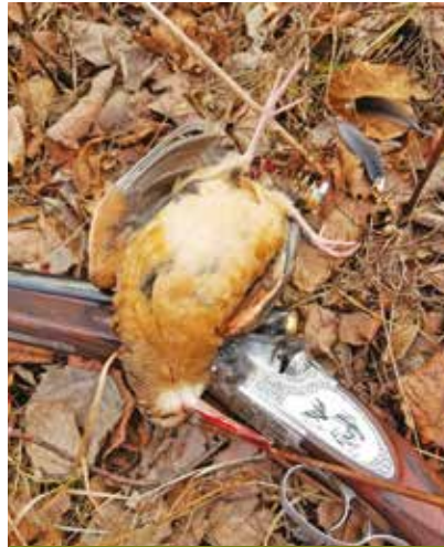
Scolopax minor, la fameuse bécasse d'Amérique.

P.V. : Nous sommes spécialistes des chasses aux oiseaux migrateurs (grande oie des neiges, bernache du Canada et canards barboteurs) et au dindon sauvage. Nous avons une très forte demande pour la grande oie des neiges. Quand ces oiseaux collaborent, le spectacle est grandiose. Nous proposons aussi des chasses à la bécasse d'Amérique et au cerf de Virginie. La Cache Outfitters donne aussi l'opportunité de pêcher le saumon Atlantique en rivière, à la canne à mouche.