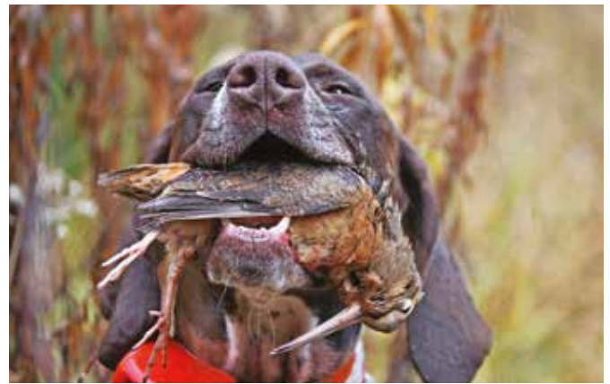
Chasser la bécasse au Québec avec son chien, c'est possible !