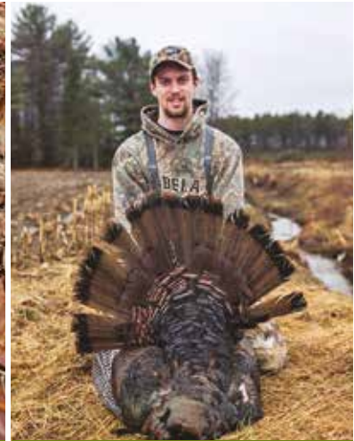
Gibier étonnant et passionnant, le dindon sauvage.

Dans quelles régions faites-vous chasser ?