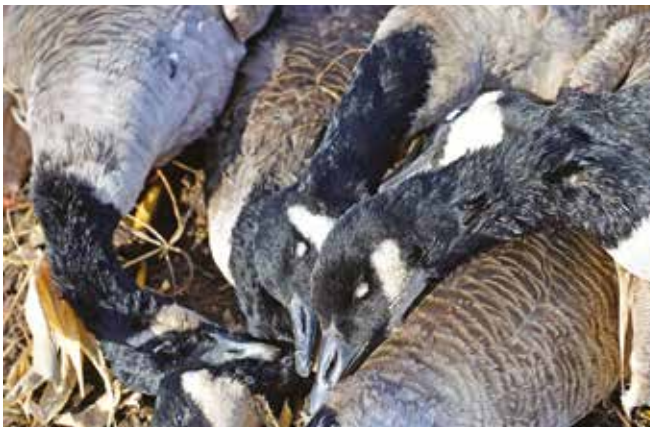
Bernaches du Canada, autrement nommées « outardes » au Québec.